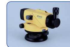
Oculaire diagonal DE22 (AT-B3/B4)