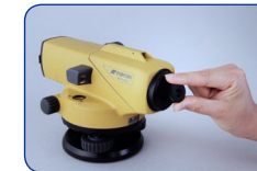
Oculaire 40x EL5 (AT-B2)