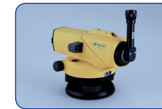
Oculaire diagonal DE16 (AT-B2)